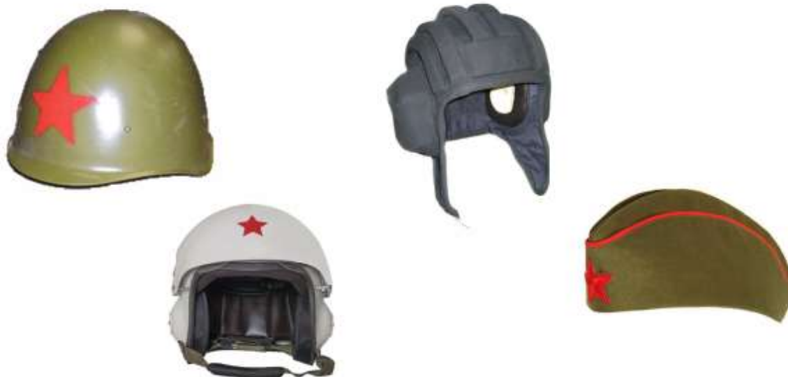
Карточка № 7