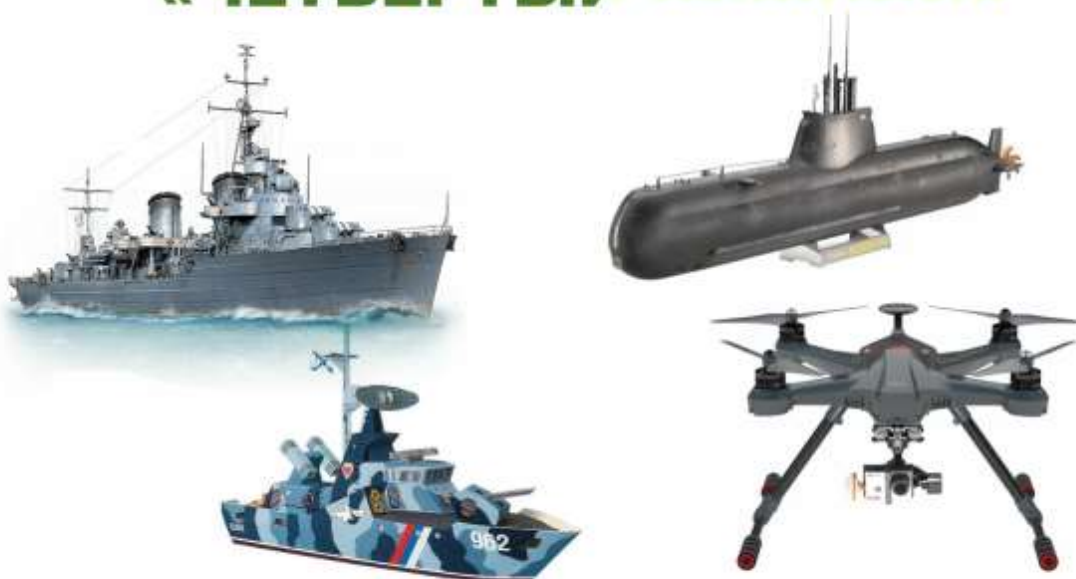
Карточка № 5