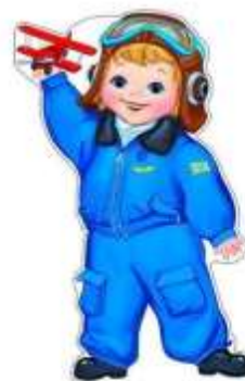
Карточка № 2