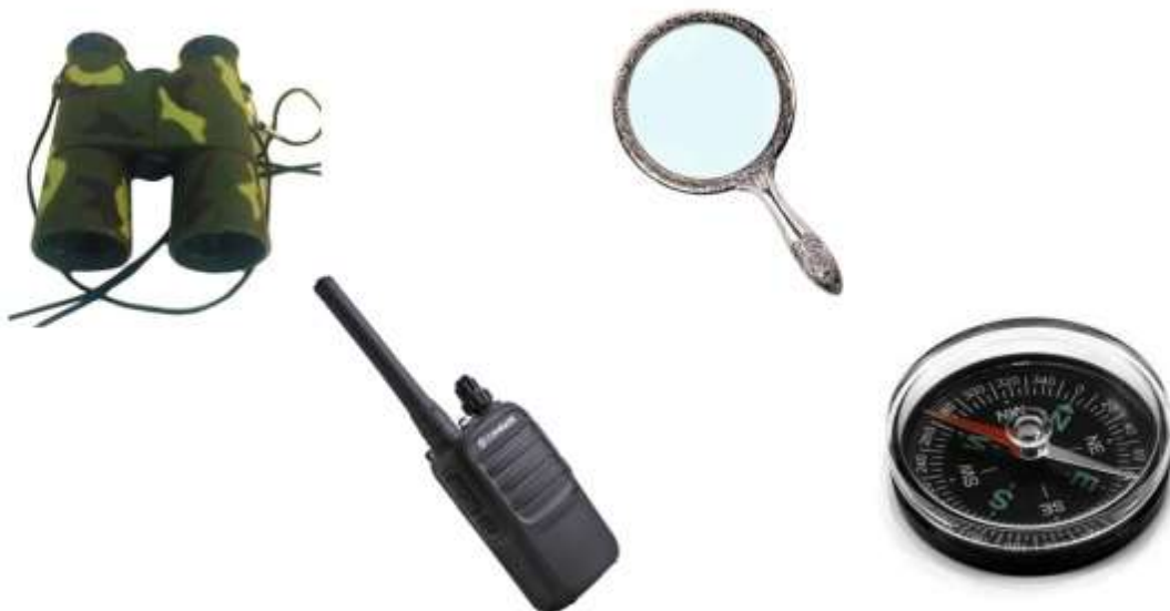
Карточка № 11