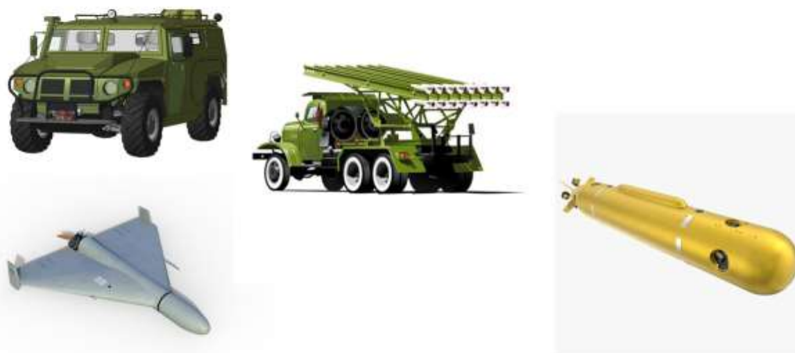
Карточка № 6