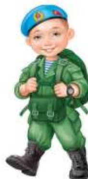
Карточка № 1