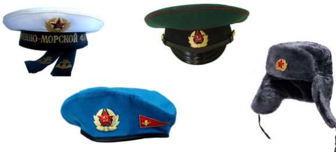
Карточка № 8